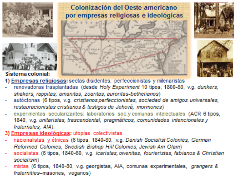
Figura 3: Sistema colonizador del Oeste americano por empresas